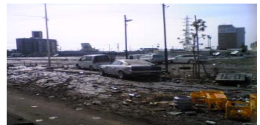
被災直後の仙台センター及び周辺状況 (2011年3月12日撮影)