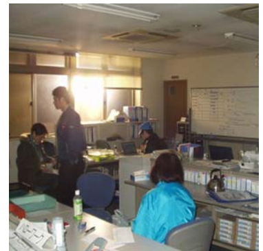
停電が続くなか発電機を使っでの作業風景と事務所内状況 (2011年4月6日撮影)